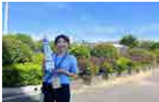
田恩与水火箭合影

在所有的道别里，我最喜欢明天见！即使我们分开了、离别了，明天依旧有所期待。大家，我们明天见！”