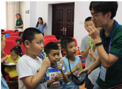
自制乐器-吸管排箫