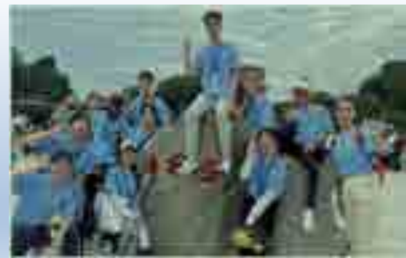
宜昌组—三峡坛子岭