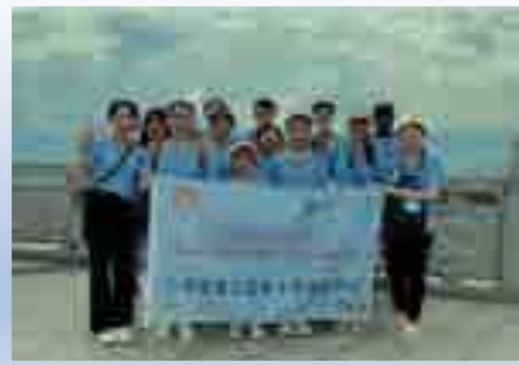
宜昌组—三峡185观景点