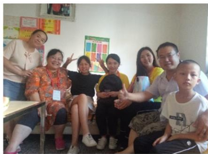
欢喜与忧愁”之老师来了