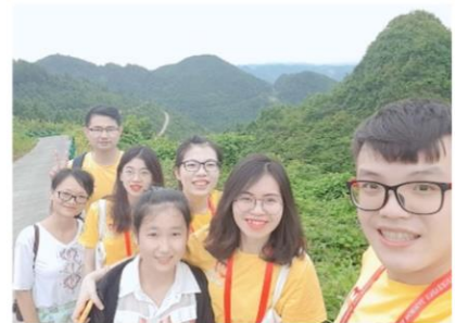
跟大山的孩子一起走回家路