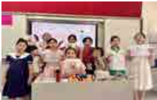
小朋友课堂成果展示