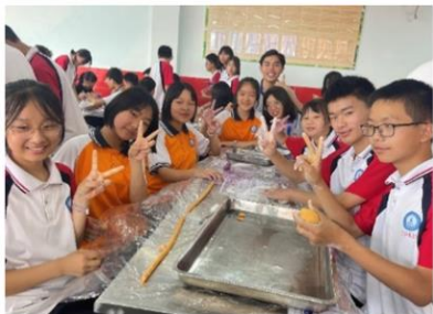
台湾美食芋圆制作