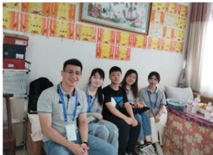
探访 别人家的孩子"