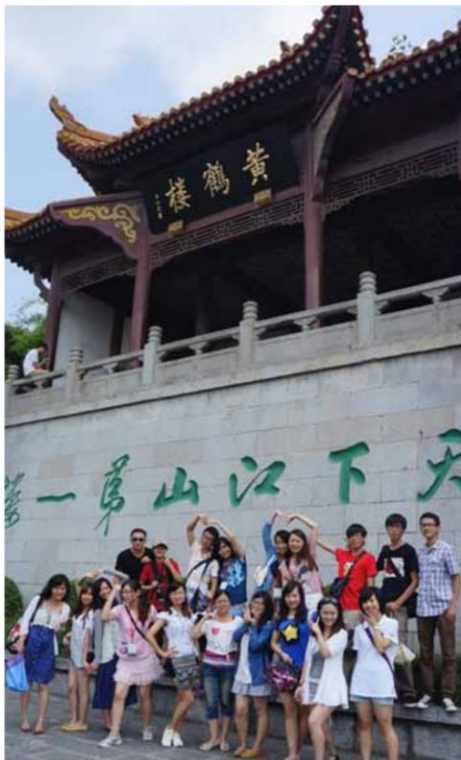
天下第一江山：黄鹤楼