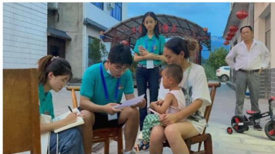
乡村实地入户调研