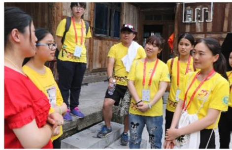
听乡亲讲“我们村的这些年”