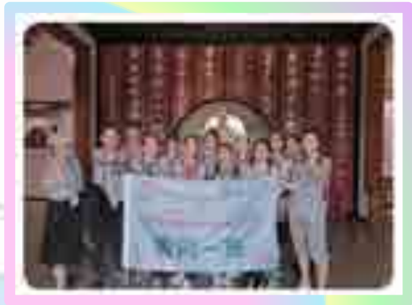
纪念馆李时珍中组合影