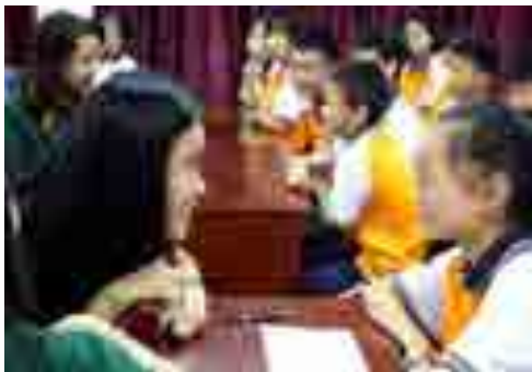
用心交流：我的眼里都是你